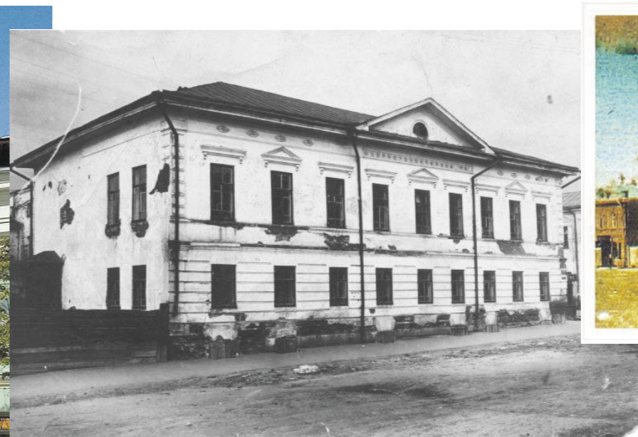
Вид здания Первого Королёвского училища в 1926 году