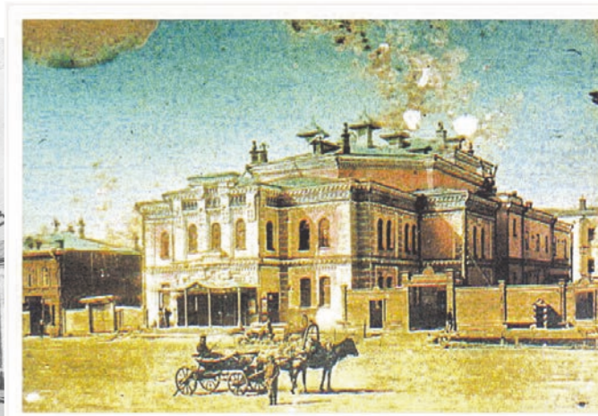
Театр купца Е. И. Королёва, старинная фотооткрытка