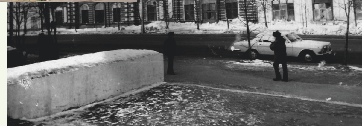
Торговый дом «Михайлов и Петров»