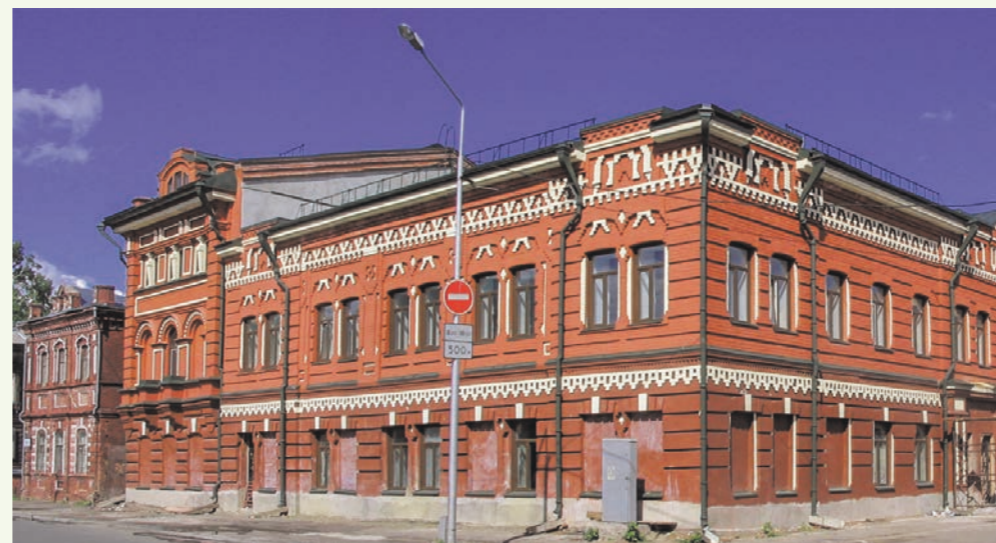
Здание Музея прикладных знаний