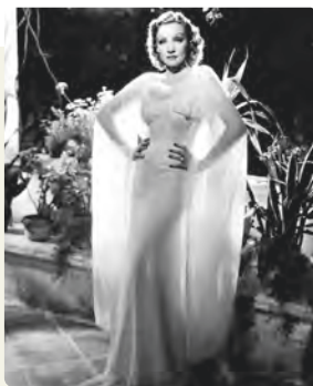
Марлен Дитрих