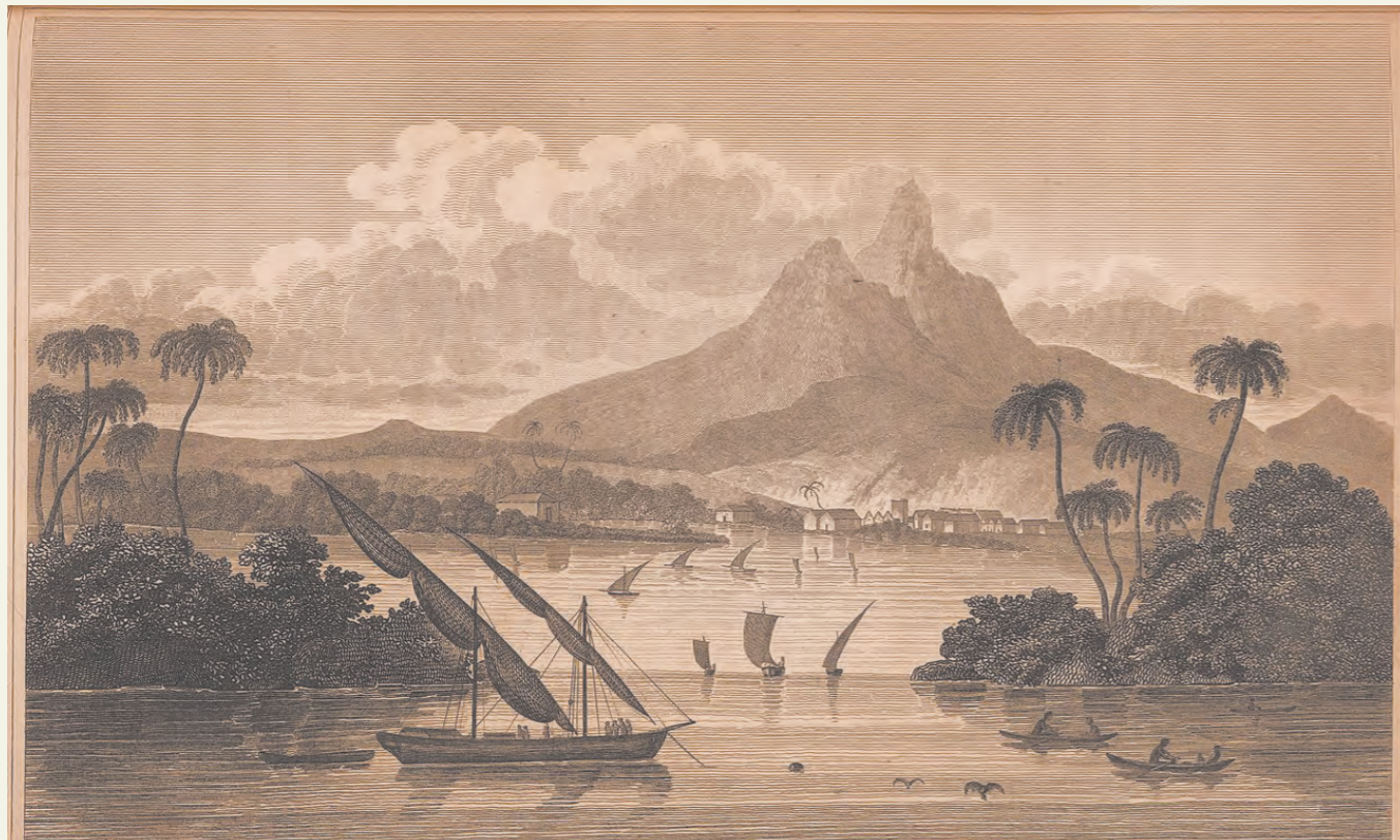
Гравюра из книги Макгрегора, изображающая живописный берег Пояиса

обещая вкладчикам большую прибыль от хорошего урожая или оборотов в торговле. Поэтому сообщения об открытии путешественником новой страны Пояис нисколько не смущают британцев. В них говорится, что государство находится на Карибском побережье, где сегодня расположены Гондурас и Никарагуа. В рекламных листовках говорится про живописные берега с чистейшими ручьями, плодородные земли и их богатые недра, золотые рудники, леса со стаями оленей и всегда большие уловы рыбы. В добавок ко всему в Пояисе приятный климат, в котором не выживают распространители тропических болезней.