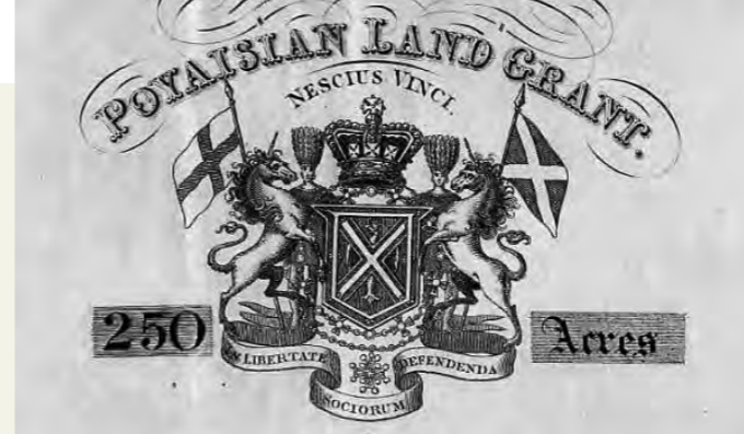
Герб Пояиса, выдуманный Макгрегором