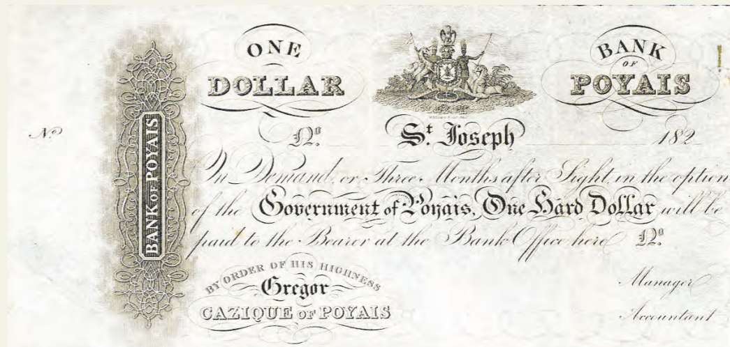
Долларовая банкнота банка Пояиса. Макгрегор заказал печать денег фальшивой страны в Банке Шотландии, а затем обменивал их переселенцам за фунты стерлингов.

рала дивизии. Когда бои в Венесуэле закончились, он с войском наемников отправился в экспедицию против испанских аванпостов. В один из походов весной 1820 года корабль Макгрегора пришвартовался к материковой части Никарагуа, в районе, известном как Берег москитов. Он представлял собой болотистую местность с большим количеством назойливых насекомых, а его единственными обитателями были племена индейцев. Поскольку раньше эта земля была колонией, Макгрегору не оставило труда убедить престарелого вождя передать ему часть джунглей в дар. Особенно легко договор о сделке пошел после того, как Макгрегор предложил взамен ром и украшения. Полученные 8 млн акров земли (32 375 км 2 ) перешли в пользование шотландца, но остались под властью правительства Москито. После этого путешествия Грегор решил вернуться в Лондон, но не тем, кем был раньше, а принцем чудесной страны Пояис — так он назвал полученную в дар территорию.