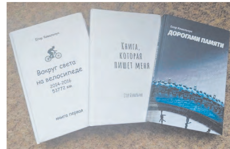
Своими впечатлениями от путешествий и наблюдениями за миром Егор делится в книгах

совой подушки безопасности адаптироваться в обществе? Заработанных в Америке денег (около 2 000 долларов на двоих, из расчета 11 долл./час) хватило на билет в Индонезию и вторую часть маршрута до Томска.