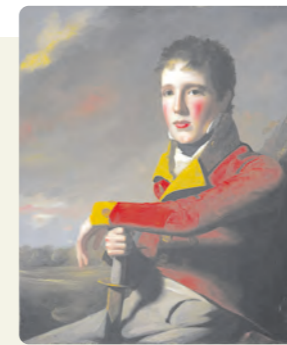
Грегор Макгрегор в юности (Художник Джордж Уотсон, масло)