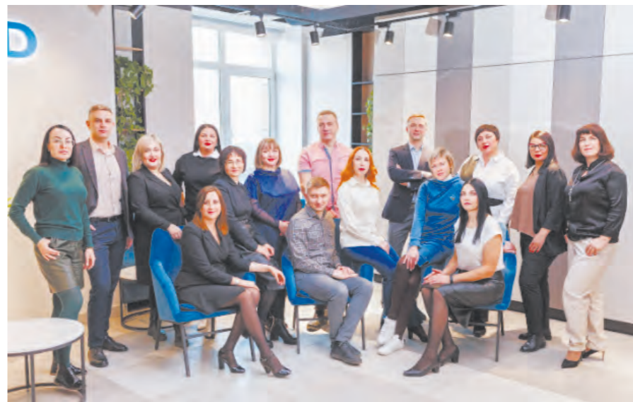
Коллектив Ассоциации риелторов Томска

Мой самый большой доход за месяц — 500 000 рублей, больше я не зарабатывала. Средний доход — 300 000 рублей в месяц.