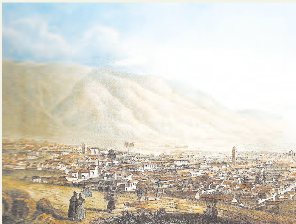
Идиллическая панорама Пояиса из путеводителя Макгрегора

Осенью 1822 года из Англии в Пояис отправился первый корабль с 70 поселенцами. Для квалифицированных торговцев и ремесленников проезд был бесплатным. Покорять новые земли поехали государственные служащие, банкир и даже сапожник с контрактом чиновника. Уже зимой к отплытию из Шотландии готовилась следующая партия из 180 пассажиров. Перед стар-